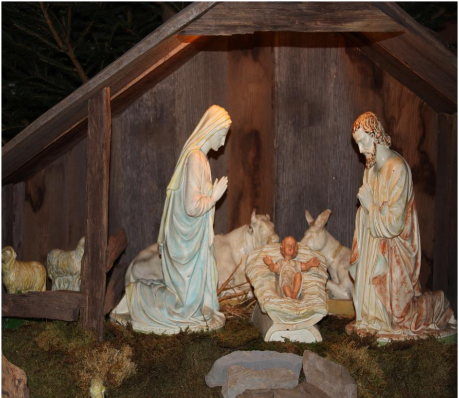
Weihnachtskrippe St. Michael Franken

für die Zeit vom 19.12.2015 bis 31.01.2016