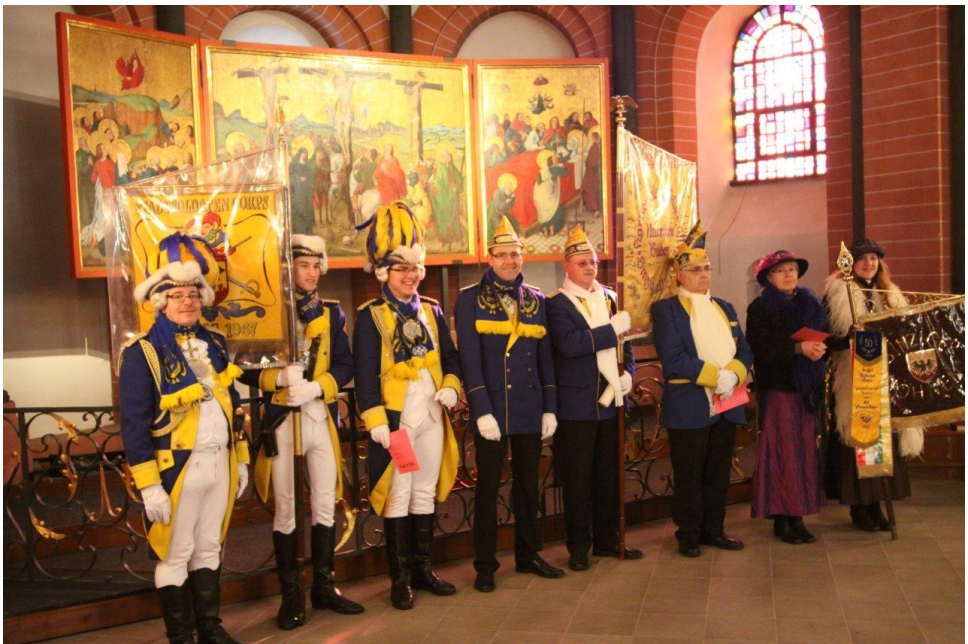
Bild: Narrenmesse 2013 St. Peter Sinzig

für die Zeit vom 30.01.2016 bis 28.02.2016