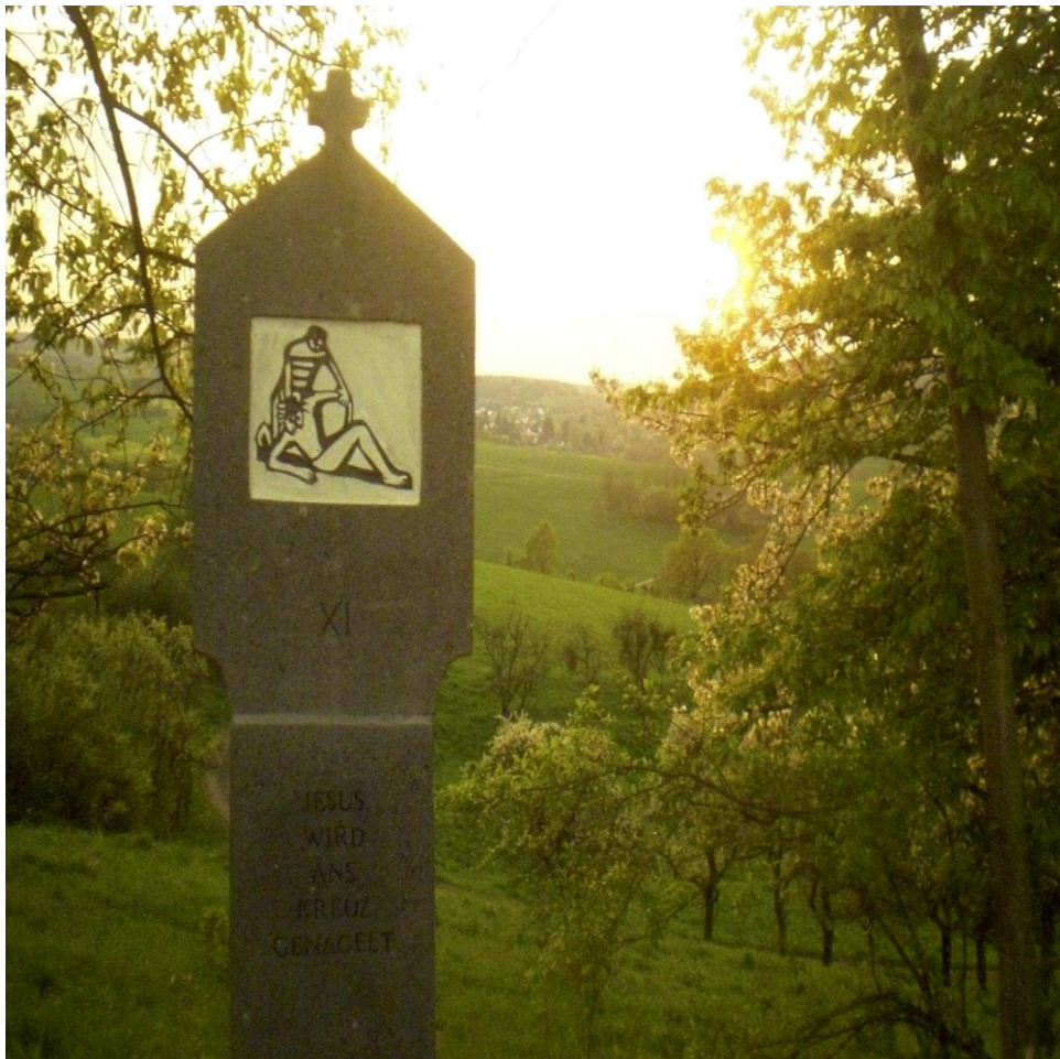
Bild: Kreuzweg Westum

für die Zeit vom 27.02.2016 bis 28.03.2016