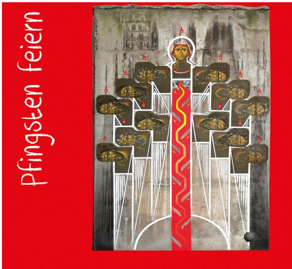
Leitmotiv der diesjährigen Renovabis-Aktion

für die Zeit vom 30.04.2016 bis 29.05.2016